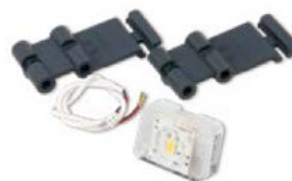
Modulo ELMM compreso. 1 PZ. RBSKITSAFE1

Completa l'impianto con il Kit supporto fotocellula e luce di cortesia per Robus!