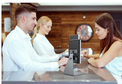
Gestione degli alberghi e dei visitatori