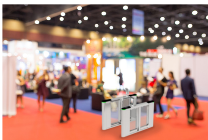
Mostre e conferenze