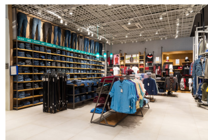
Negozi e piccole imprese